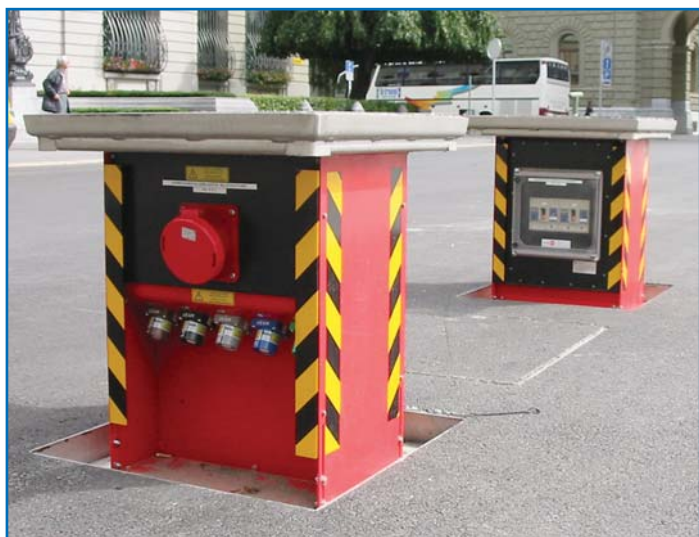
Bloc d'énergie rétractile, avec amortisseur à pression de gaz

⇒ GIFAS Distribution électrique souterraine ⇐ Énergie propre et discrète!